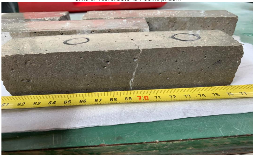
Slika 1: Vzorci betona v obliki prizem