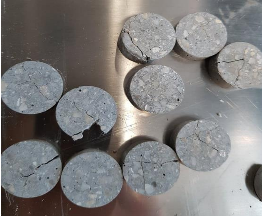
Slika 3: Efekt samo-celjenja ACR reakcije v betonu z dolomitnim agregatom